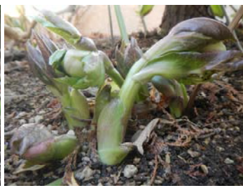
クリスマスローズ